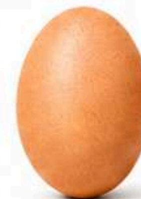
Extra (58g a 67,99g)