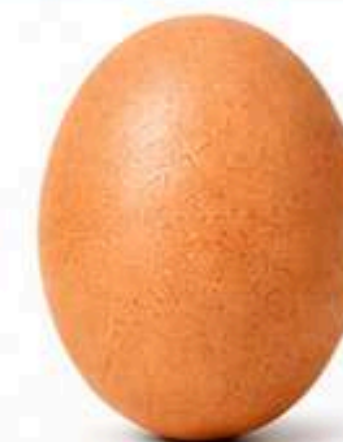
Jumbo (Mínimo 68g)