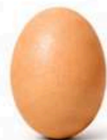
Médio (38g a 47,99g)

Os parâmetros para avaliação da qualidade e definição do destino dos ovos, seja para consumo ou descarte, em conformidade com a Portaria SDA/MAPA nº 1.179/2024 e suas alterações.